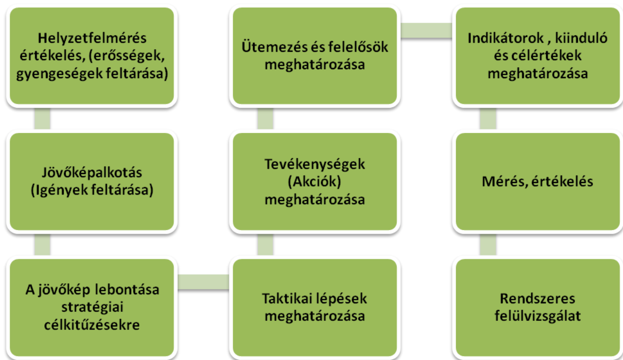
A stratégiai dokumentum tartalma

Stratégia kidolgozása esetén a stratégiai dokumentumnak tartalmaznia kell mind a koncepcionális megalapozást, mind a megvalósítás tervét (Akcióterv). A dokumentumnak önállóan alkalmazhatónak, önmagában megvalósíthatónak kell lennie. A dokumentum javasolt tartalmi elemei: